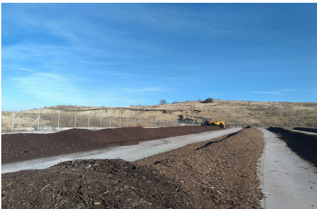
Сн. 1: Инсталация за компостиране към Регионално депо за битови отпадъци Видин

По отношение на биоразградимите и биоотпадъци на територията на Община Видин липсва организирана система за разделно събиране. Единствено „зелените“ растителни отпадъци от паркове и градини се събират от „Еко Титан“ ЕООД. Същите се транспортират до компостираща инсталация в Регионалното депо за битови отпадъци, където се обработват. Растителни отпадъци от паркове и градини за 2016 г. е 461,58 тона.